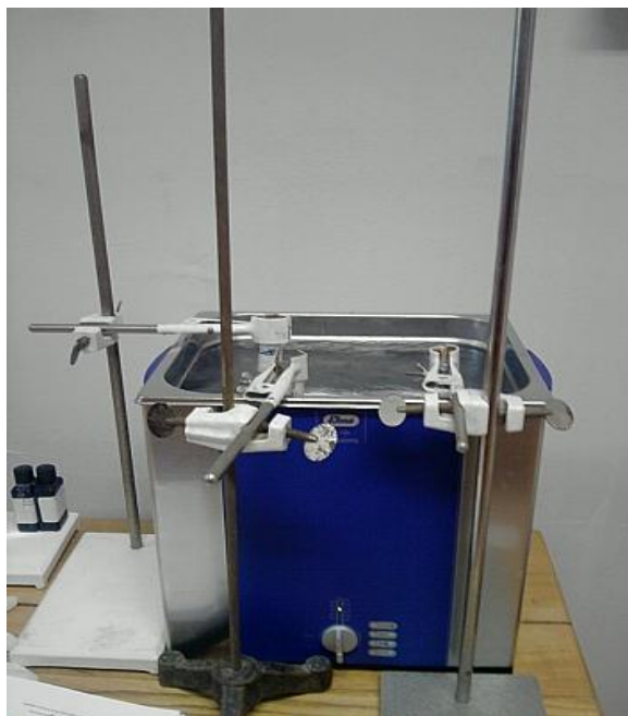
2. ábra: ELMASONIC S120 típusú ultrahangos készülék