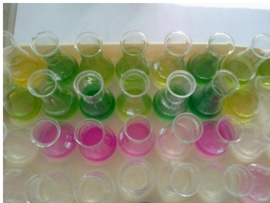
1. kép: Nitrogénformák meghatározásához a minták előkészítése

A mérés az MSZ ISO 7150-1 szabvány szerint történik. A hozzáadott szalicilat- és oxidáló reagensek hatására a minta az ammónium-tartalom mennyiségének függvényében elszíneződik, a keletkező zöld szín mélysége az ammónium koncentrációjával egyenesen arányos. A vízminták koncentrációját spektrofotométeren határozzuk meg látható tartományban, 670 nm-en. [1]