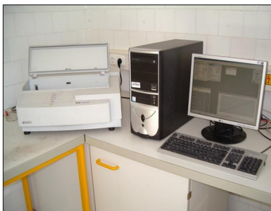
2. kép: KDV -KTVF Környezetvédelmi Laboratórium Unicam UV 500 típusú fotométere

A fotometriás mérés során a fotométer a mintán adott hullámhosszú fényt bocsát keresztül. A minta színének megfelelő hullámhosszon az elnyelés mértéke arányos a vizsgált komponens koncentrációjával. Minden vizsgált komponensre féléves gyakorisággal ún. kalibrációs görbét kell felvenni, azaz az adott komponensből ismert koncentrációjú oldatsort kell készíteni, fotométeren lemérni a különböző ismert töménységű oldatok fényelnyelését, azaz abszorbanciáját (extincióját) a komponens meghatározott hullámhosszán (ahol az abszorpciós maximumát kimérték). Grafikonon ábrázolni kell a mért értékeket: az x-tengelyen a koncentrációt, az y-tengelyen az extinciót. A kalibrációs görbe felvétele után bármely oldat adott komponensekre ismeretlen koncentrációja meghatározható extinciója lemérésével. [2]