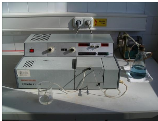
3.kép: Spekol 21 típusú fotométer a KDV-KTVF Környezetvédelmi Laboratóriumában

A két fotométer a mérhető hullámhossz-tartományon kívül abban is különbözik, hogy a Unicam UV 500 típusú fotométer a mintára mért fényelnyelés értéket (abszorbancia) közvetlenül a tárolt kalibrációs görbére vetíti, így mindig a minta koncentrációjának pontos értékét olvassa le. [2] A Spekol 21 típusú fotométer nem tárol kalibrációs görbét. Minden komponensnél ki kell számolni az ún. szorzószámot, amelyet úgy kapunk meg, hogy a kalibrációs görbe minden egyes pontjához tartozó koncentrációértéket elosztjuk az arra a pontra mért abszorbanciával, majd a különböző pontokra kapott hányadosokat átlagoljuk.