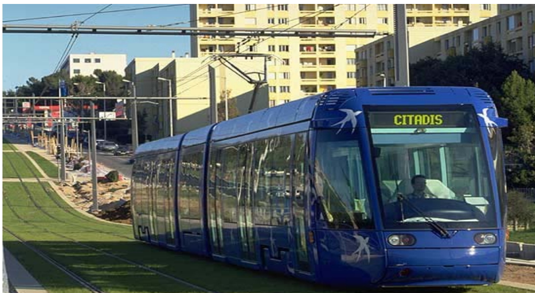
2. ábra Fűvesített villamos pálya (Montpellier) [7]

A zöldfelületek esetében egyedileg megállapítható értékkepző a táji érték és a városképben betöltött pozitív szerep. Ezek a tényezők a lakható város nélkülözhetetlen elemei, amelyekkel nap mint nap szembesülünk. A zöldfelületek különböztetik meg a tájat a kő- vagy homoksivatagoktól.